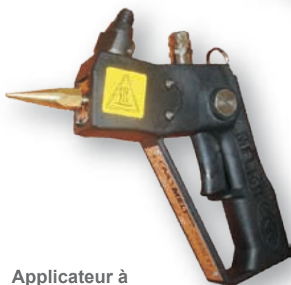
Applicateur à perle A4

La gamme de produits d'application de Valco Melton offre une sélection complète d'applicateurs d'adhésif thermofusible et d'équipements de support :